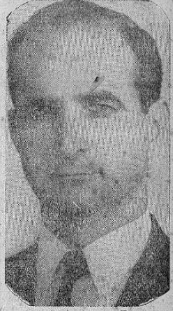
Don José Figueres Ferrer

Paralelizando su actitud con la de los gobernantes de los principales países democráticos del mundo, el Sr. Presidente Figueres inauguró el recién pasado lunes 11 del mes en curso sus conferencias con la Prensa Nacional y representantes de la Extranjera, anunciando en esta primera su propósito de continuar celebrándolas, para lo cual, de la manera más gentil solicitó a los concurrentes sus opiniones sobre los días y horas en que éstas pudieran celebrarse, habiéndose acordado que, salvo en ocasiones especiales, las ordinarias se efectuarán los días primero y tercero lunes de cada mes, unas a las once de la mañana, otras de las tres de la tarde.